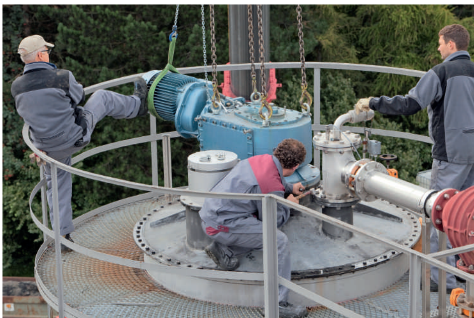
Grosse Motoren sind überall im Einsatz; hier bei einer Kläranlage in Arbon

Das Potenzial der Schweiz ist gross: Laut dem erstmalig im Auftrag des Bundesamtes für Energie BfE durchge-