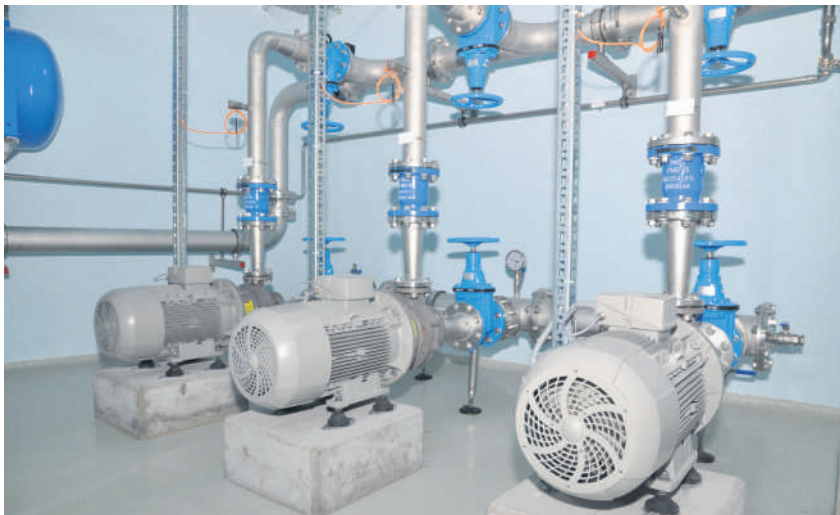
Die drei neuen Pumpen in Blockbauweise mit elektrischen Motoren à 15 kW Leistung haben den IE4-Standard. Das Unternehmen IVF HARTMANN AG spart mit ihnen CHF 8000 Stromkosten im Jahr; der Payback beträgt 4 Jahre.